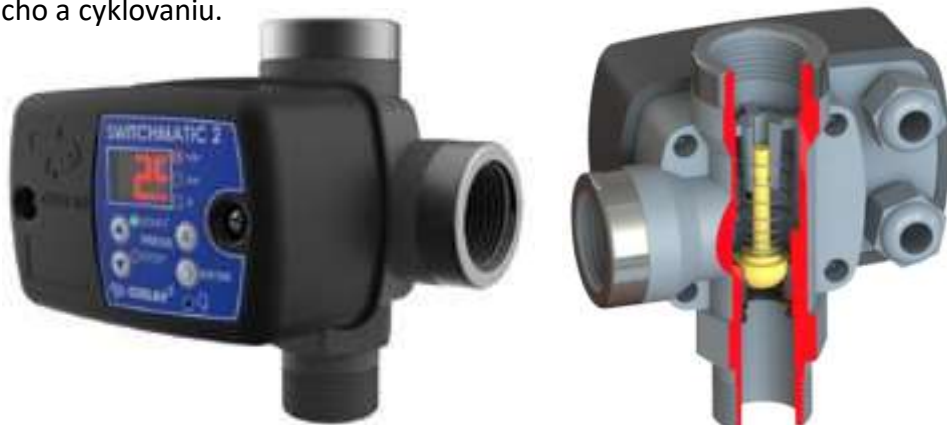
T-KIT Switchmatic 2